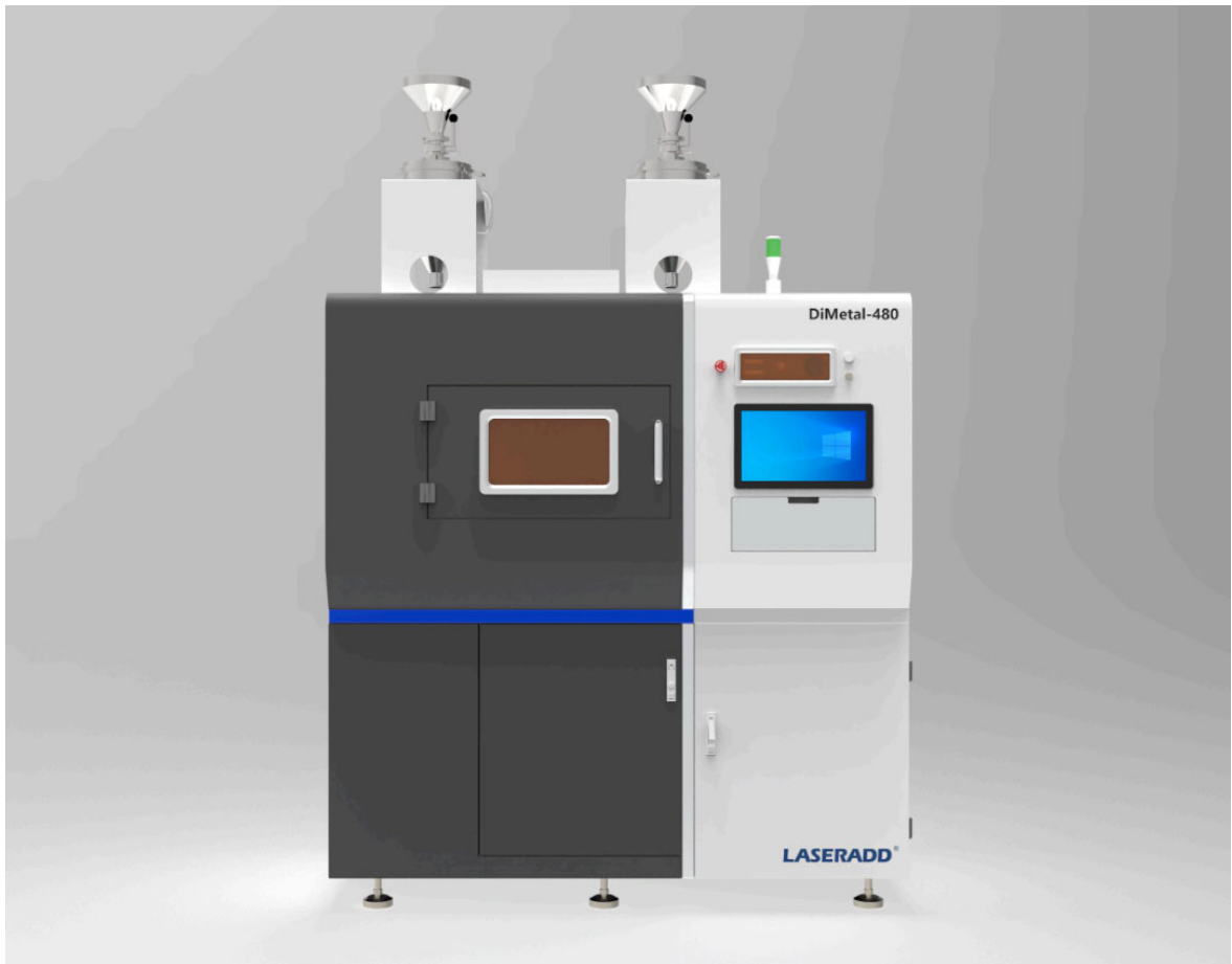
激光选区熔融设备DiMetal-480

此次获奖是对金石三维长期以来坚持自主研发和创新驱动的认可。未来，金石三维将加速推动科技成果产业化进程，促进产业链上下游协同创新，为新质生产力发展贡献科技力量与行业智慧。