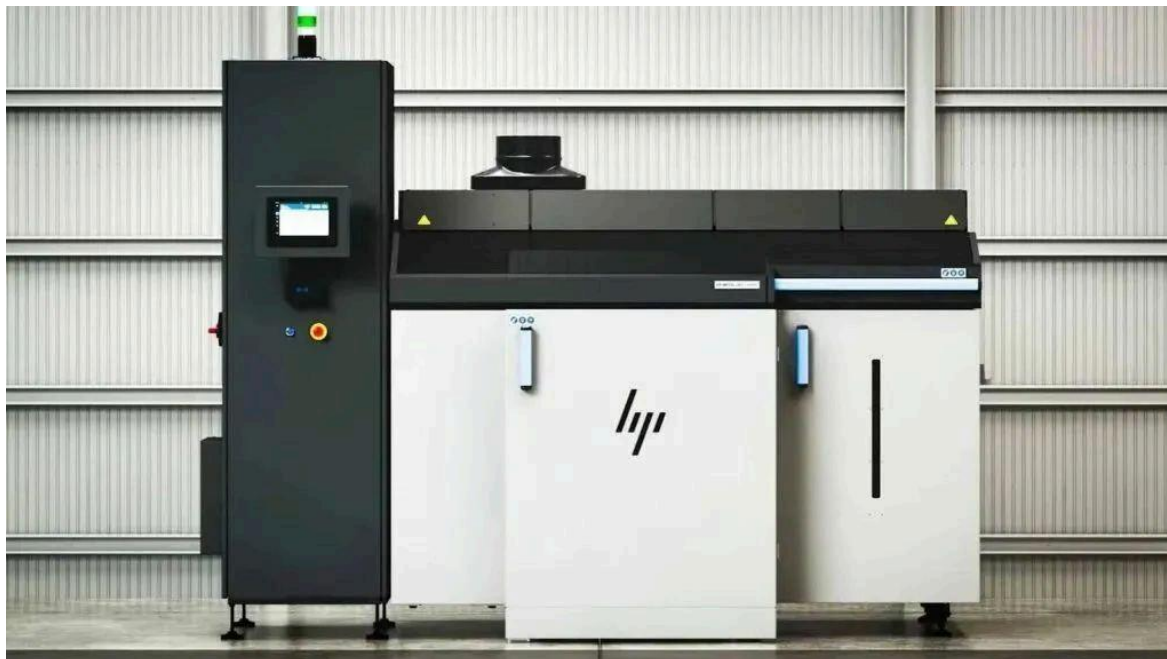
△HP Metal Jet S100打印机

凭借INDO-MIM在金属粉末开发方面的深厚专业知识，这家印度公司能够充分利用HP的平台，快速扩展金属粘结剂喷射的应用范围。为了满足不断增长的市场需求，INDO-MIM计划通过增加5台HP MetalJet S100设备来提升它的生产能力。这一举措将使得这家印度公司能够更加高效地交付高质量的定制产品。