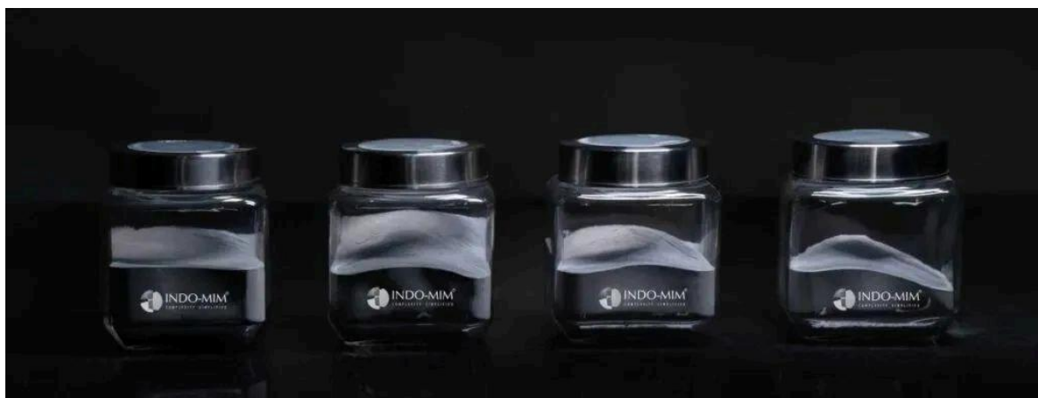
△INDO-MIM的金属3D打印粉末材料展示

目前，HP Metal Jet S100使用两种不锈钢粉末：HP Metal Jet SS 316L和HP Metal Jet SS 17-4PH（工艺参数据说可达到MPIF 35的特性）。惠普称，其它材料也已经过评估，可以针对特定应用和特性进行开发。