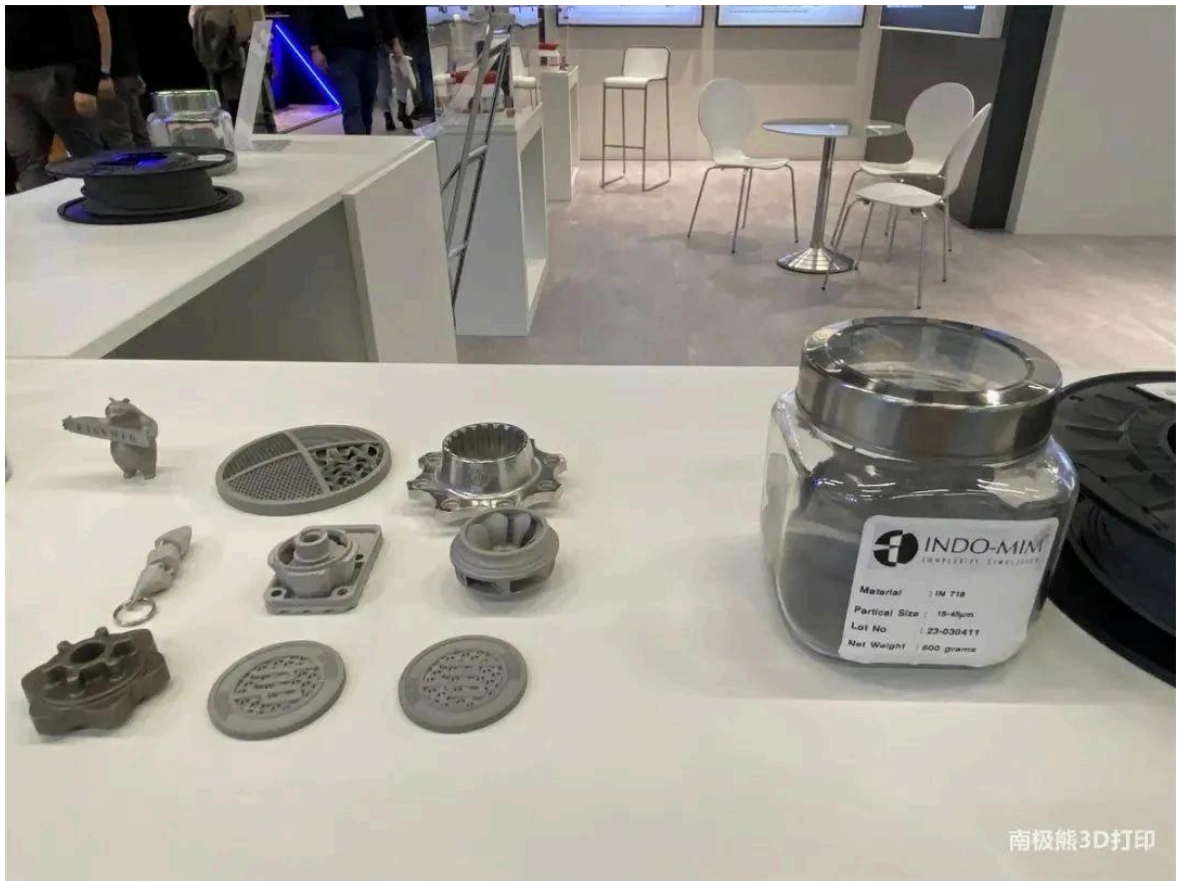
△南极熊在2023年德国Formnext展会上拍摄的INDO-MIM展位照片