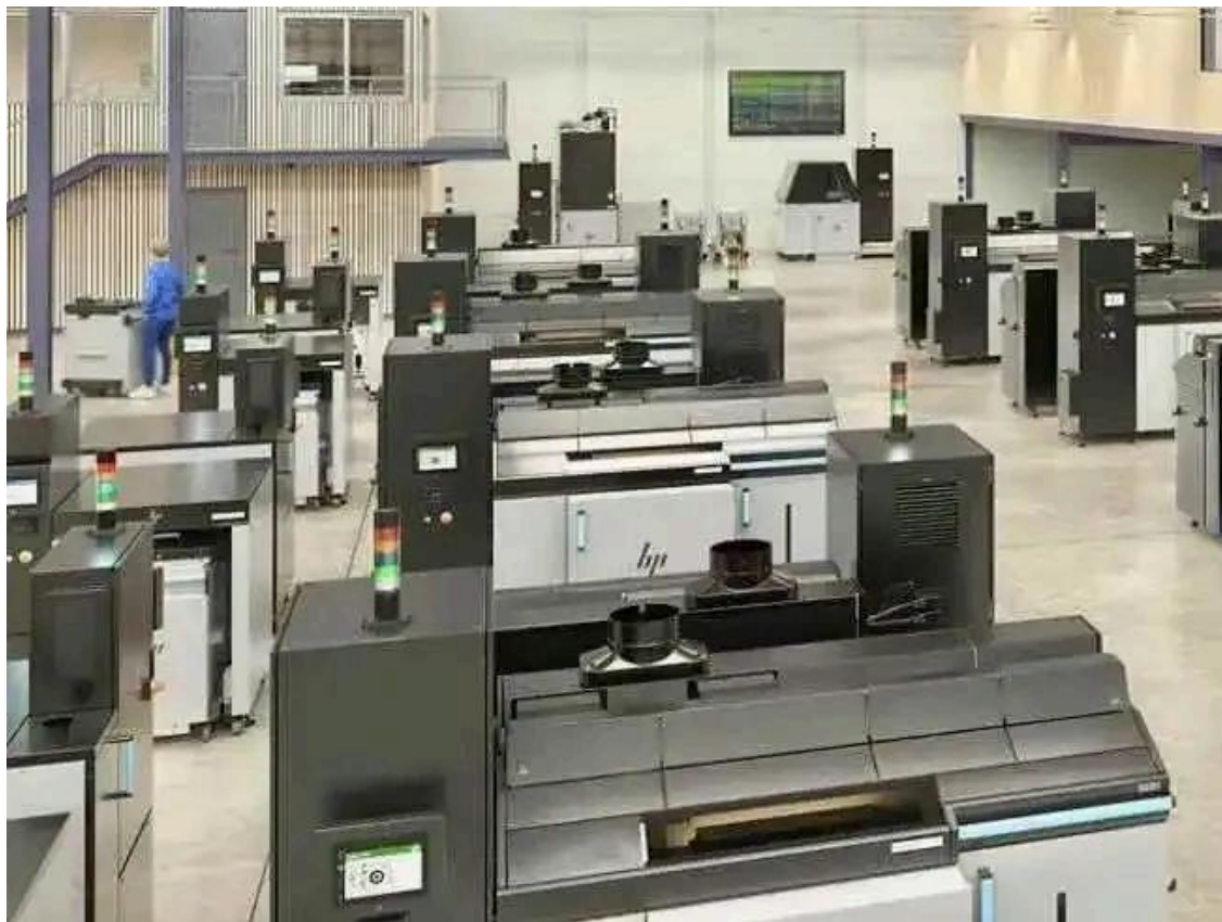
AS100队列，后墙上有辅助处理装置

印机使用惠普热喷墨打印头，可以显著提高打印速度、部件质量和可重复性，而使用的粘合剂利用惠普的乳胶化学物质来制造更坚固的绿色部件，无需脱胶，更坚固的环保零件，其质量可达到工业生产级别。